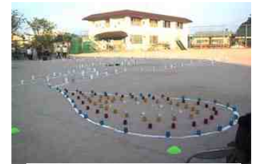
手前の部分が水しずくをあらわす

森が火事になった時、たった一羽のハチドリ・クリキンディがくちばしに水を含み、いったりきたり、火に水をかけた。他の動物は無駄だと笑ったが、クリキンディは「私は私のできていることをしているだけ」と答えたというお話から作製されました。