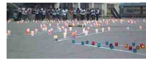
このキャンドルは、牛乳パックの中に溶かした蝋を入れ、20秒たったら転がして作る