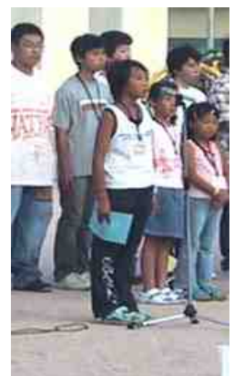
児童によるはじめの言葉